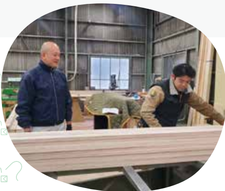
先輩の仕事の様子を見学中...