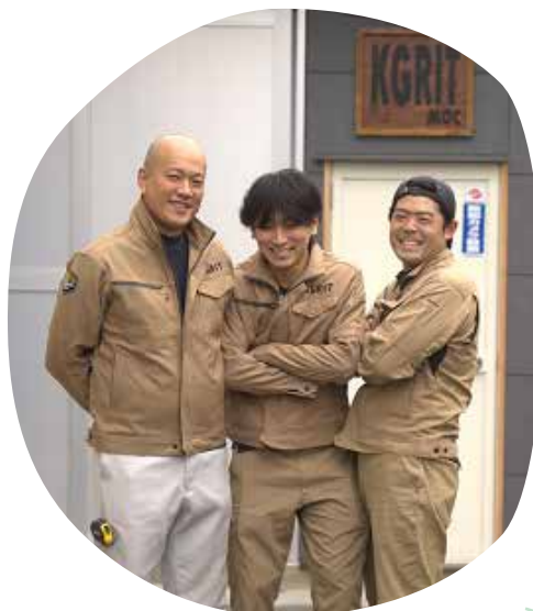
MOCメンバーの3ショット