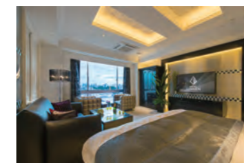
(設計・監理：(株)KOGA設計)